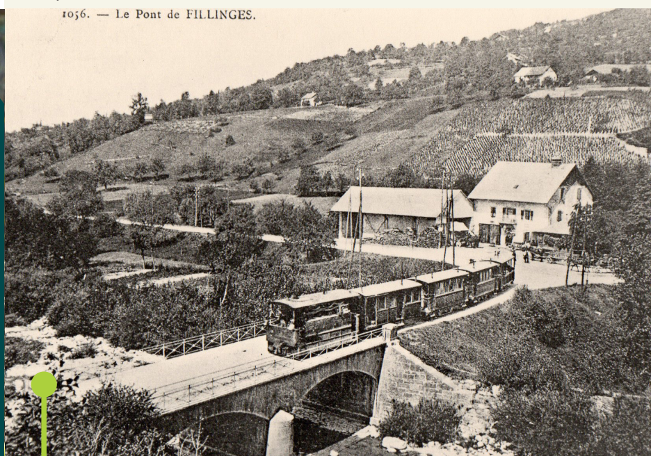
1036. — Le Pont de FILLINGES.

Au « Pas de Lachat », suivez « La Maisonnée ». Avant d'y arriver, vous croiserez d'autres poteaux vous l'indiquant. Une fois arrivés, vous irez vers « Chez Pilloux » en traversant la route. Du poteau directionnel, faites attention à bien vous diriger vers « La Verne ». Ensuite, vous n'avez plus qu'à continuer vers « Pont de Fillinges (Parking) » pour rejoindre votre point de départ.