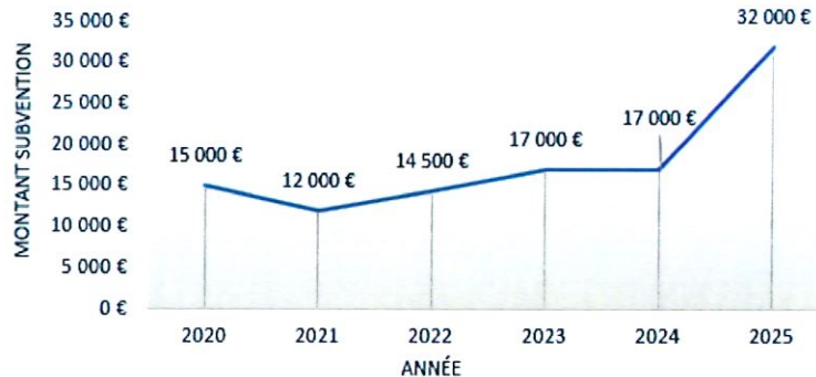
Evolution versement subvention épicerie sociale (2020 à 2025)

Entre 2024 et 2025, la fréquentation de l'épicerie sociale a subi une forte augmentation. Le nombre de bénéficiaires adultes passait de 25 à 35 (+40 %), et celui des bénéficiaires enfants de 15 à 20 (+33 %).