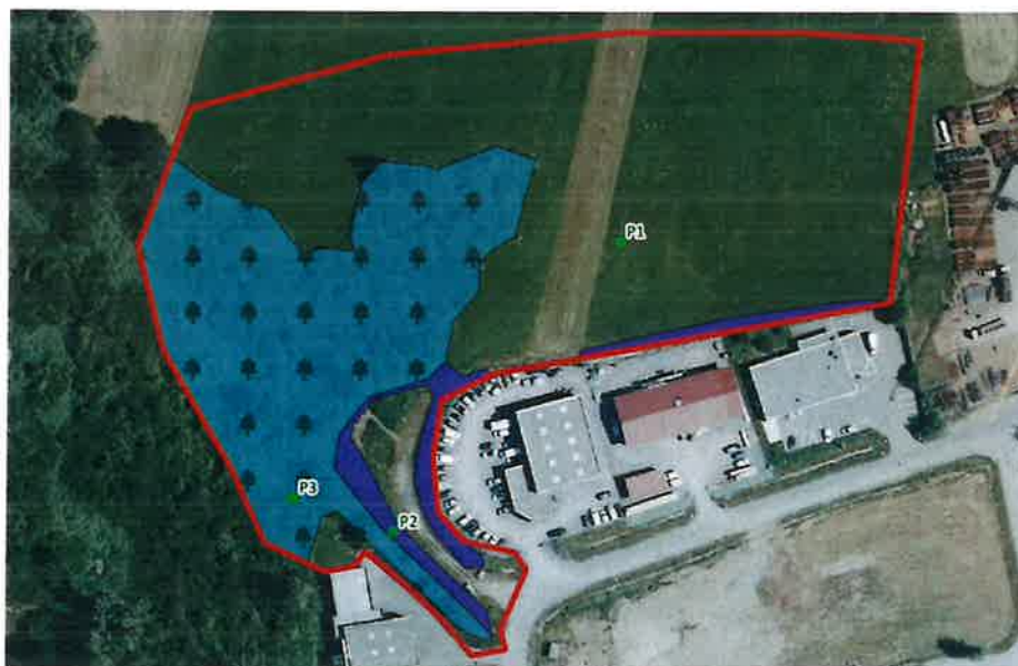
Carte n°2 : carte délimitation zone humide

Afin de respecter intégralement la Zone Humide, la Communauté de Communes des 4 Rivières a fait réaliser par le cabinet EPODE une étude Zone Humide, pour délimiter avec précision, les contours de cet endroit à préserver. Cette étude a mis en exergue une zone humide dont les contours diffèrent légèrement de ceux fixés par le PLU.